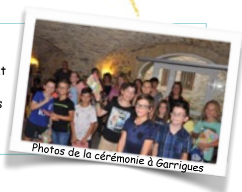
Photos de la cérémonie à Garrigues

Les élèves des classes des CM2 de Garrigues et St-Hilaire de Beauvoir ont reçu leur cadeau de fin de scolarité élémentaire. Chacun s'est vu offrir une calculatrice qui fait partie de la liste des fournitures scolaires de la 6ème. Les élus leur ont souhaité de s'épanouir pendant leur scolarité au collège et un bel été.