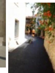
Inauguration vendredi 30 août à 18h30