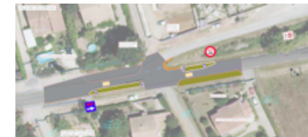
Projet d'aménagement entrée de ville côté de Sommières