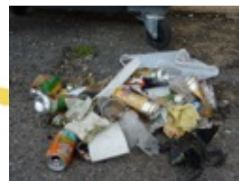
Collecte des marcheurs de la Bénovie et des services techniques

- Oui, et si chacun fait sa part, juste sa part, nous y serons encore mieux.